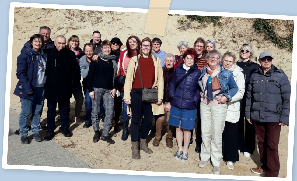
WEEKEND DES FAMILLES À LA MER, 2024