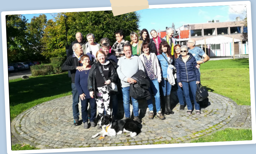
RENCONTRE DES FAMILLES, LUBIN - 2023