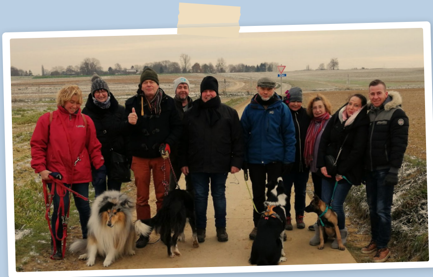
PROMENADE DES MEMBRES - GEMBLOUX