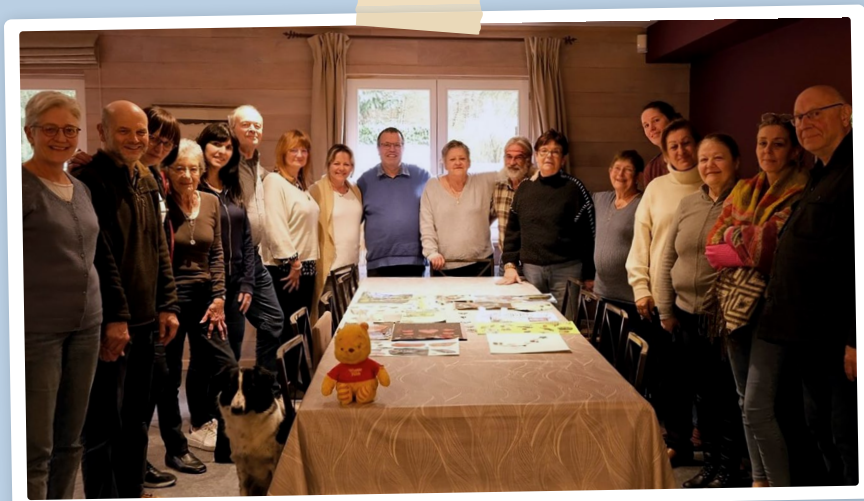
WEEKEND DES FAMILLES - LUBIN, 2024