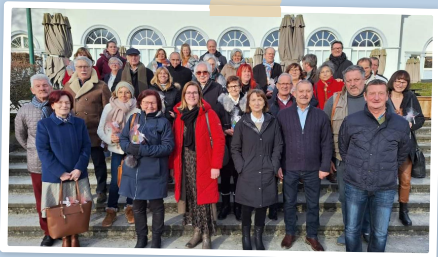
JOURNÉE DES MEMBRES ACTIFS - 2024