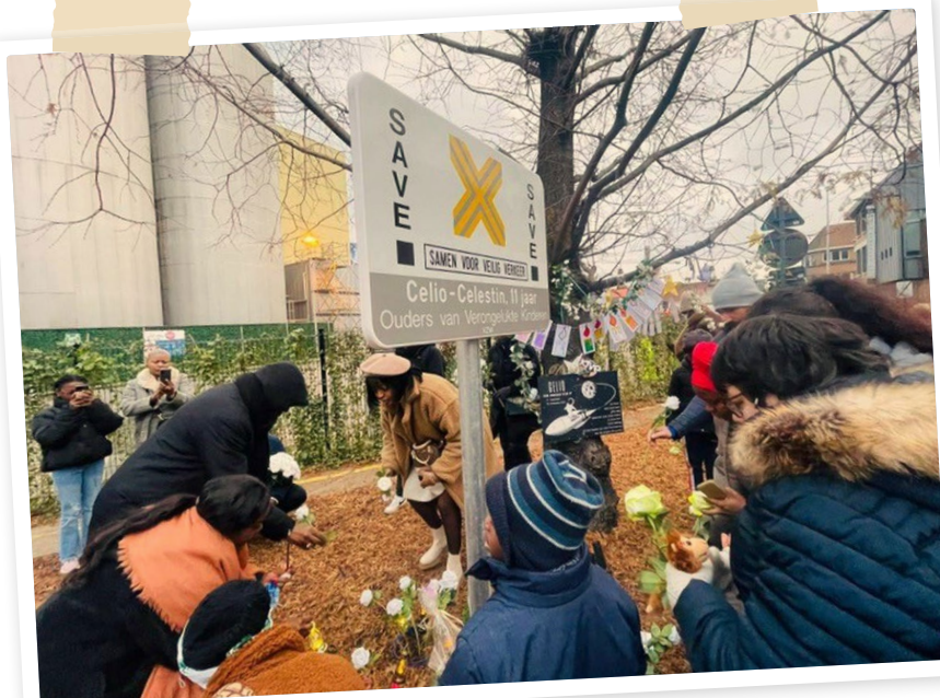
INAUGURATION PANNEAU SAVE CELIO-CELESTIN 11 ANS - ALOST

Le panneau SAVE est avant tout un signe de solidarité avec les proches de la victime de la route. En outre, il a également un objectif de sensibilisation: il encourage les usagers de la route à adopter un comportement prudent dans la circulation.