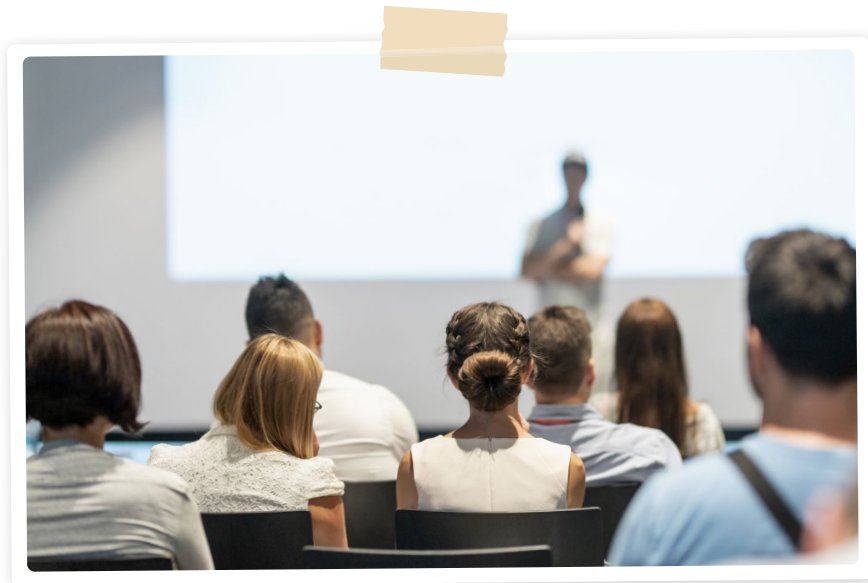
TÉMOIGNAGE DE PAIRS EN SECONDAIRE