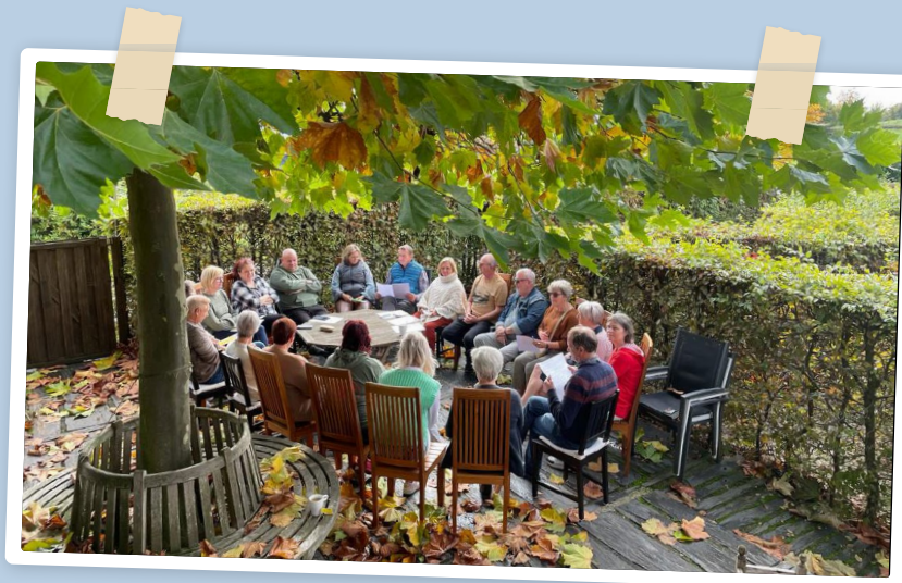
ATELIER D'ECRITURE BOUILLON - OCTOBRE 2022