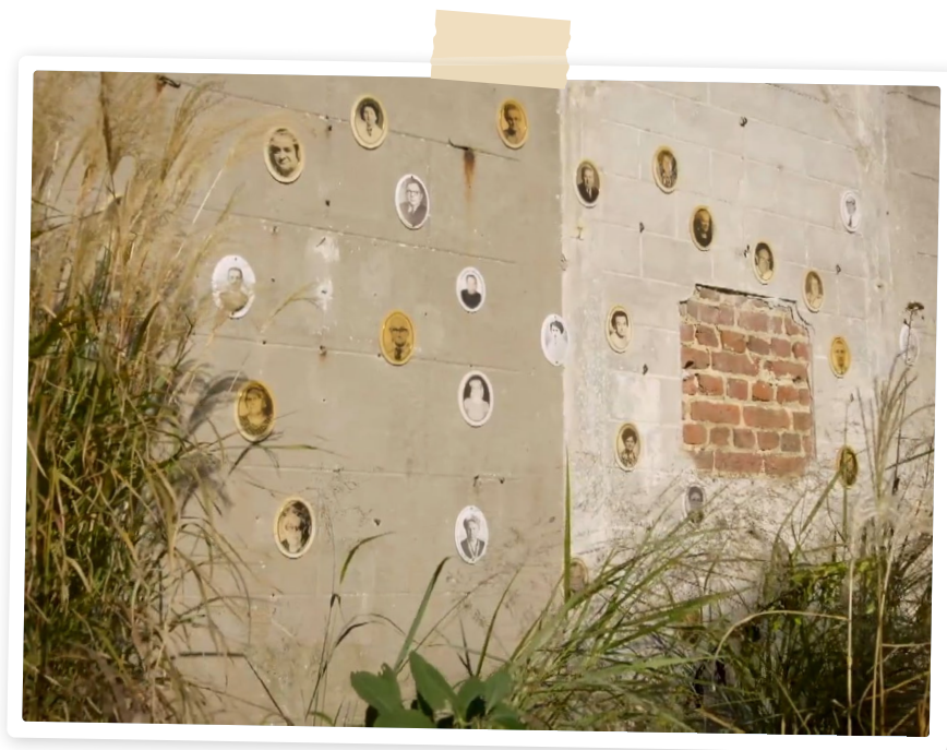
MUR DE CONSOLATION DANS LE CIMETIERE DE LA VILLE DE LOUVAIN

Les cimetières classiques font traditionnellement partie de notre patrimoine culturel. En partie grâce à une « révolution du deuil », des projets (citoyens) connectés et participatifs voient aujourd'hui le jour. L'asbl PEVR-SAVE plaide pour une augmentation du nombre de lieux de commémoration et d'autres initiatives visant à rendre visible le deuil dans l'espace public . Ces lieux offrent réflexion, tranquillité, connexion et recueillement. Ils contribuent à normaliser le deuil et la perte dans le quotidien et sont visibles par tous.